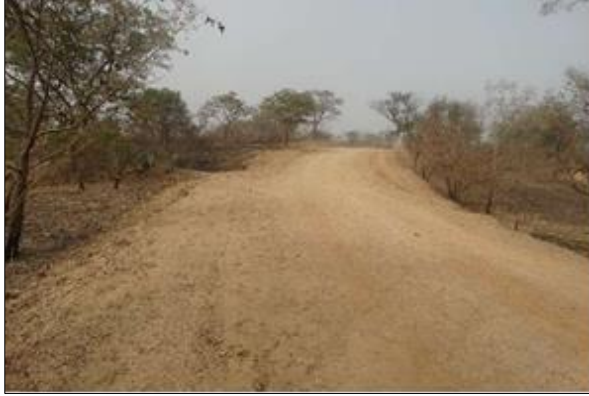
LOT n°1 : Région de la Kara _ dégagement des bandes latérales (démarrage des travaux)