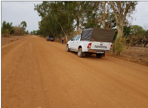
LOT n°1 : Région de la Kara _ Piste en rase campagne (fin des travaux)