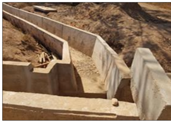
LOT n°1 : Région de la Kara _ Réalisation des caniveaux (phase travaux)