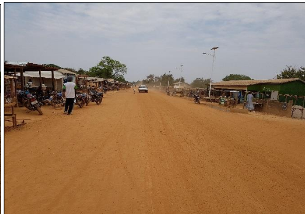
LOT n°1 : Région de la Kara _ piste assainie en agglomération (fin des travaux)