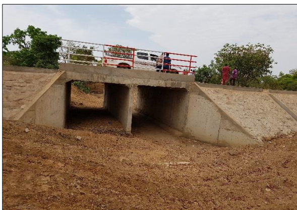
LOT n°1 : Région de la Kara _ dalot (fin des travaux)