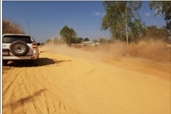
LOT n°1 : Région de la Kara _ Zone de sol fin à débarrasser (phase travaux)