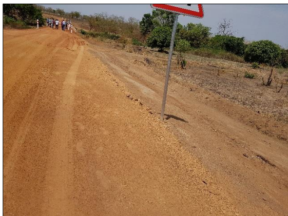
LOT n°2 : Région de la Kara _ Piste en rase campagne ( travaux en cours)