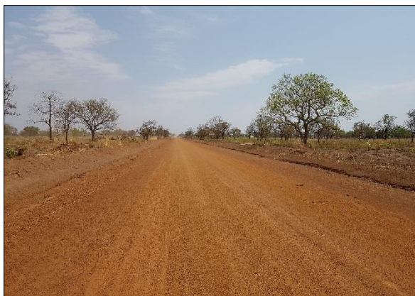
LOT n°2 : Région de la Kara _ Piste en rase campagne (fin des travaux)