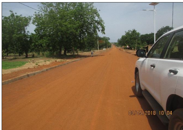
LOT n°2 : Région de la Kara _ piste assainie en agglomération (fin des travaux)