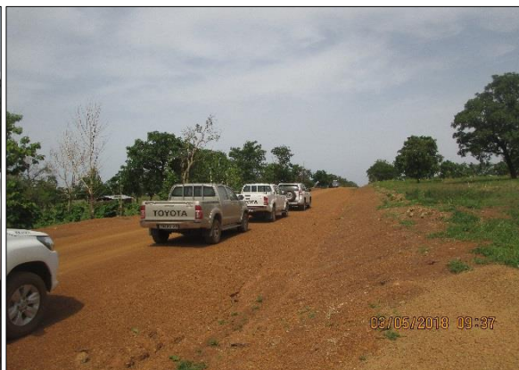
LOT n°2 : Région de la Kara _ Piste en rase campagne (fin des travaux)